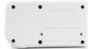
Vista posterior, tapa atornillada del compartimento de la pila